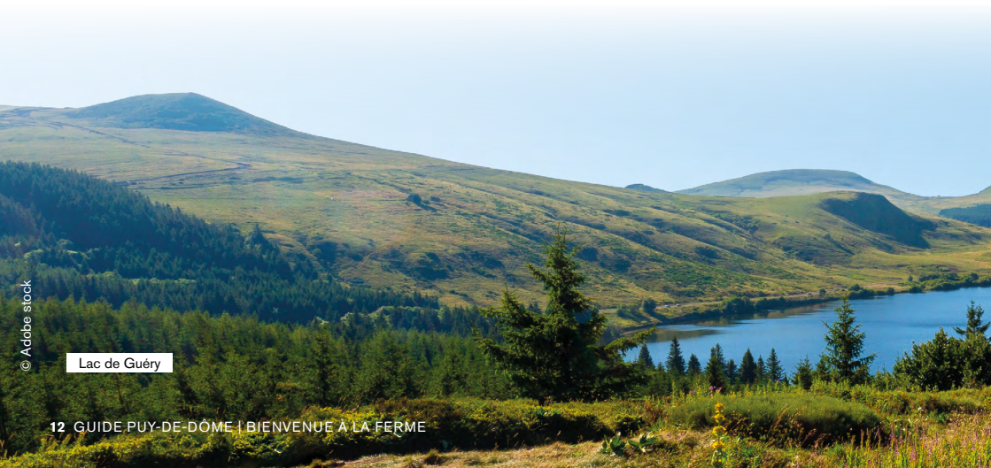
Lac de Guéry

Vignes situées sur les coteaux de Chateaugay au nord de Clermont-Fd.