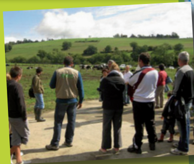
Imprimés par nos soins - Ne pas jeter sur la voie publique.

Vendredi : Visite de la ferme, pour découvrir la production de lait, l'alimentation de nos vaches... Une activité transformation du lait en fromage blanc vous attend, suivie d'une dégustation. Sans oublier la rencontre avec les autres animaux de la ferme ! Possibilité de participer à la traite du soir à 17h30, venez essayer de traire une vache.